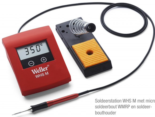
Soldeerstation WHS M met micro soldeerbout WMRP en soldeerbouthouder

Ideaal voor alle soldeertoepassingen die geen High-tech apparatuur vereisen, maar toch professioneel dienen te geschieden. Ontworpen voor gebruik bij reparaties, service en hobby, speciaal toepasbaar op model-RC gebied.