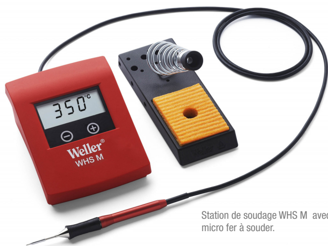
Station de soudage WHS M avec micro fer à souder.

Idéale pour les applications délicates sur site. Elle est parfaitement adaptée aux ateliers de réparations et aux hobbies.